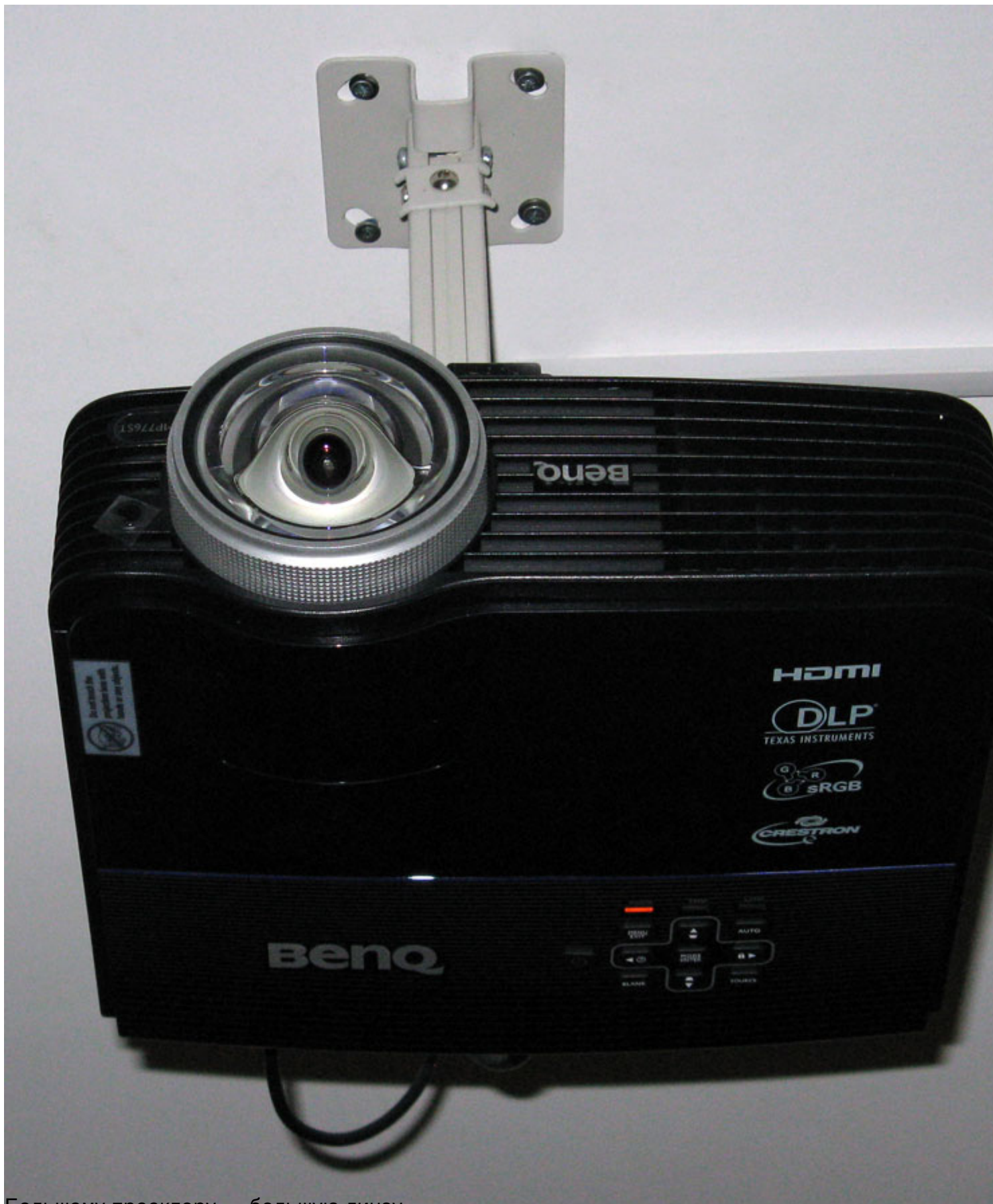
Большому проектору — большую линзу.